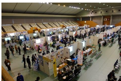
▲アリーナ内の様子