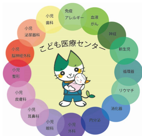
各診療科の連携図

山口大学医学部附属病院こども医療センターでは、小児科・総合周産期母子医療センターのほか、外科、脳神経外科、泌尿器科、耳鼻咽喉科、眼科、皮膚科、整形外科、歯科口腔外科など幅広い診療科が連携してお子さんの診療にあたります。