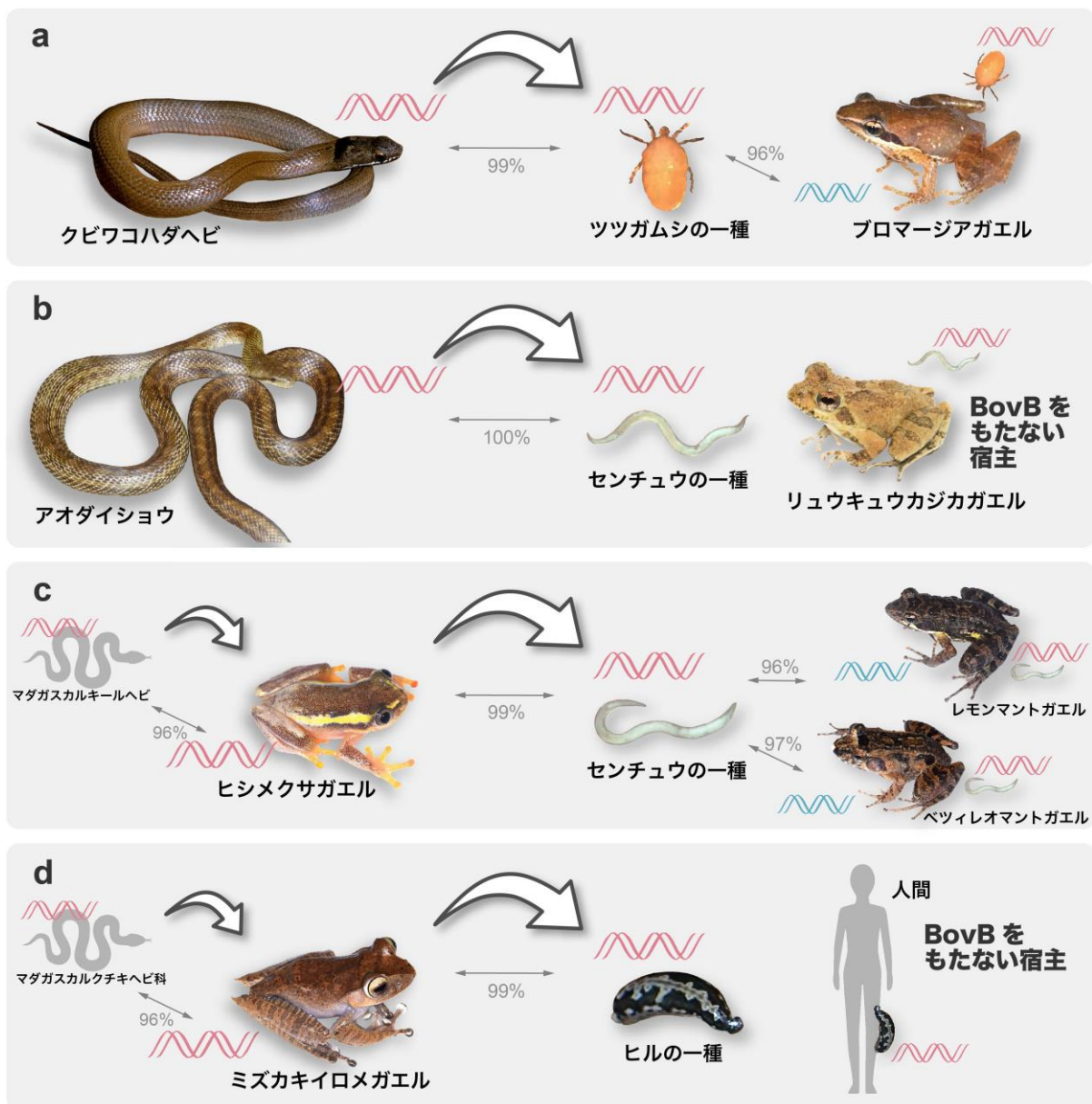
図 1. 寄生虫を介した水平伝播経路の代表例。太い矢印は伝播の方向、細い矢印は動物間の BovB の塩基配列相同性を示す。赤色の DNA は、ヘビからカエル、もしくは、ヘビから寄生虫に水平伝播した BovB、青色は、カエルが元々もっていた寄生虫とは異なる BovB を示す。