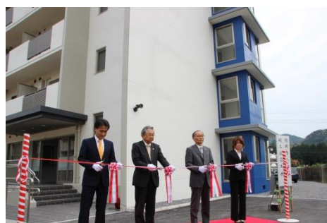
榎野寮2号棟竣工記念式

榎野寮(1号棟)は昭和42年に62名分だけが建設され、教養部の女子1年生が入寮した。翌年には残り94名分の居室が完成し、156名収容可能となった。平成26年にバス・トイレ付のワンルーム型の2号棟が新築され、今後は1号棟の改修工事が予定されている。