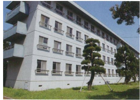
常盤寮 B 棟

常盤寮は宇部の工学部のキャンパス内にある。宇部工業専門学校時代の昭和16年に建設された木造の寮は、台風等の被害もあって老朽化したため、昭和51年、新寮(常盤寮A棟・B棟)が建設された。当時としてはめずらしく個室タイプであった。A棟は今後改修工事が予定されている。