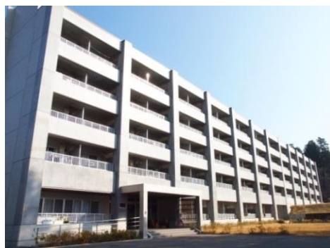
改修後の吉田寮1号棟

吉田寮(1号棟)は昭和42(1967)年に設置された。開設時に吉田地区への統合移転を完了していたのは、農学部と教養部だけだったが、96%という高い入寮率だった。当初は2人部屋(150室)だったが、平成23年に单身用ワンルームマンション型の2号棟(130室)が完成。学生の交流の場として各階に談話室が設けられているほか、生活空間としての快適性を考え、各部屋にはトイレ、バス、空調設備、机、ベッドが設置された。翌年には、老朽化及び耐震対策に伴い1号棟が改修され、2号棟同様、ワンルームマンション型(176室)となった。